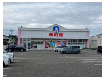
西松屋寺尾台店 約1,800m