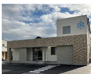
【開院予定】 まさご皮膚科クリニック 約1,700m