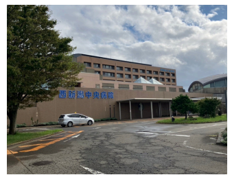
西新潟中央病院 約1,900m