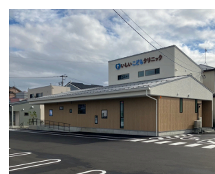
いしいこどもクリニック 約1,600m