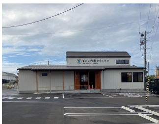
まさご内科クリニック 約1,600m