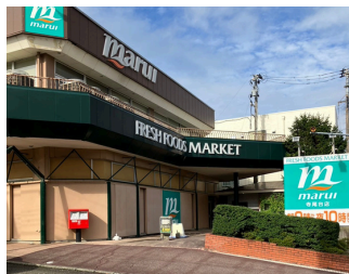
マルイ寺尾台店 約1,500m