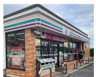
セブンイレブン上新栄町店 約450m