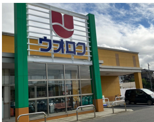
ウオロク上新栄町店 約700m