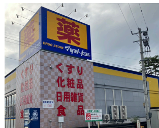
マツモトキヨシ真砂店 約1,800m