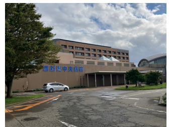
西新潟中央病院 約1,900m