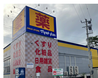
マツモトキヨシ真砂店 約1,800m