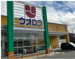
ウオロク上新栄町店 約700m