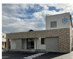
【開院予定】 まさご皮膚科クリニック 約1,700m