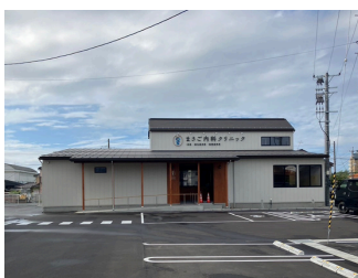
まさご内科クリニック 約1,600m