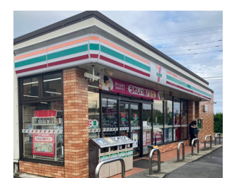
セブンイレブン上新栄町店 約450m