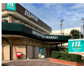
マルイ寺尾台店 約1,500m