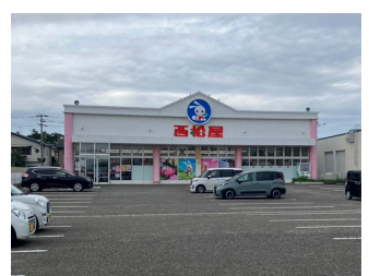
西松屋寺尾台店 約1,800m